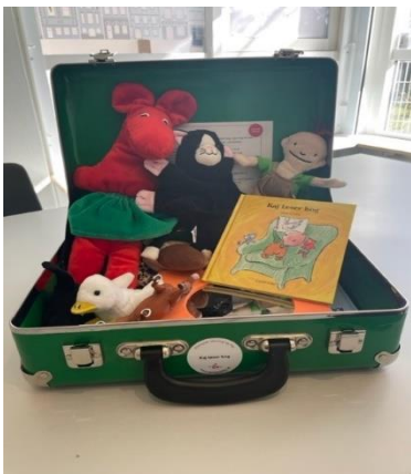
Sprogkuffert om Kaj