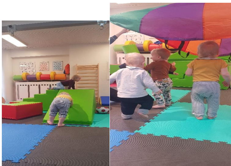
Styrkelse af de motoriske færdigheder

Fremme interessen for fysisk udfoldelse, og styrke de motoriske færdigheder ved at bruge eks. vores fællesrum og legepladsen. Der er der mulighed for alle former for bevægelse -bla. dans, gyngede, klatre, bolde osv. Dette styrker deres primærsanser som ligevægtssansen, følesansen og muskel-led sansen