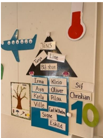
"Huset" med hvem er kommet, på ferie eller syge

Vi har et "hus" hængene på stuerne, hvor vi til morgensamling sætter børnenes navne ind, for at se, hvem der er kommet. Her lærer børnene både at genkende deres eget navn, men også hinandens.