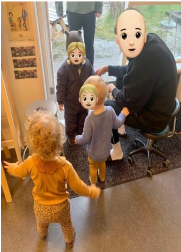
Jeg siger god morgen til min ven

Fx har de voksne lavet det til en rutine med børnene, at hver morgen, når der kommer børn ind på stuen, gør vi børnene opmærksom på, at nu kommer der nogen. Vi snakker om, hvem det er og siger godmorgen til hinanden. Dette har resulteret i, at når et barn kommer om morgen, bliver det mødt af kammerater, der siger godmorgen, vinker, giver krammer og/eller på anden måde udviser glæde ved at se hinanden igen. Dette er med til, at det barn der kommer ind ad dørene straks, føler sig som en del af børnefællesskabet på stuen.